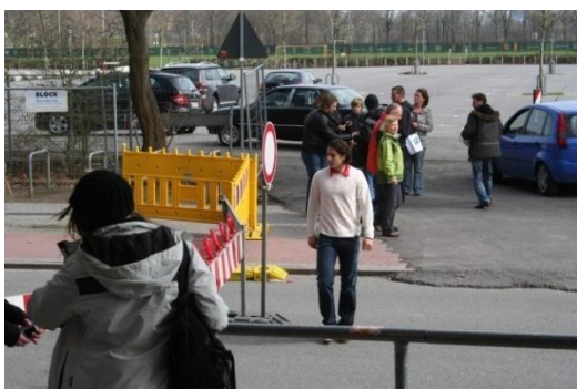
Gwiazda Werderu- Claudio Pizarro