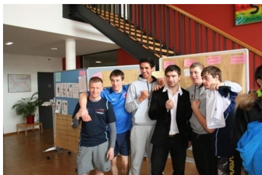
Ekipa z Walii