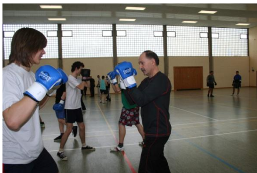
Dyskusja z uczniem zawsze jest ciekawa