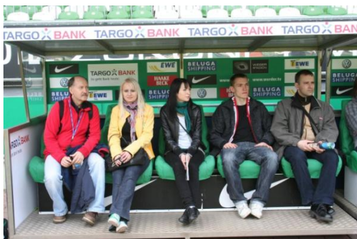
Ławka mocno rezerwowa