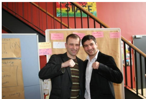
Mistrz świata boksie (ten z Prawej)