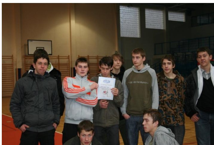
IV drużyna mistrzostw powiatu