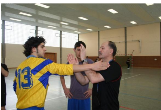
Polsko-Włoska różnica zdań