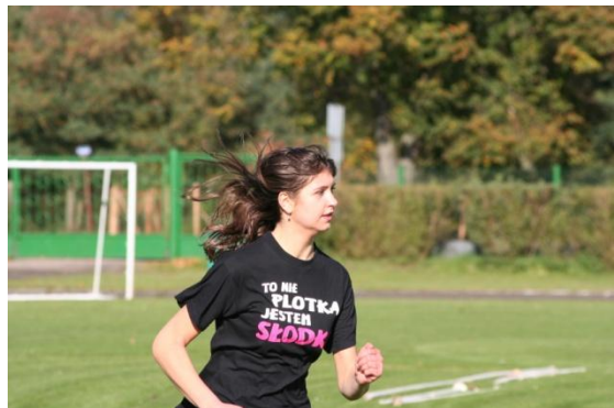
To nie jest plotka...