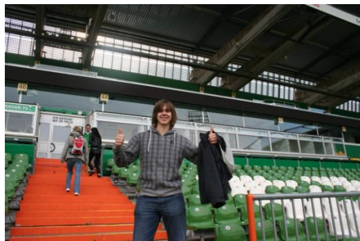
Fan FC Barcelona na stadionie Werderu