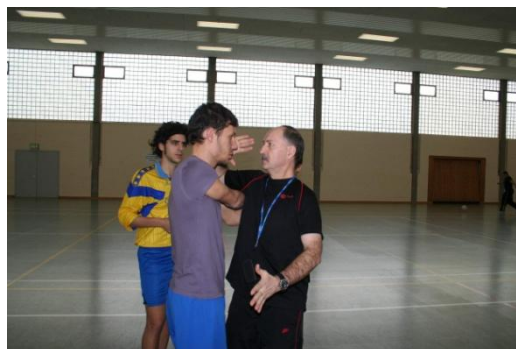
Przyjaciół przyjacielem ale...