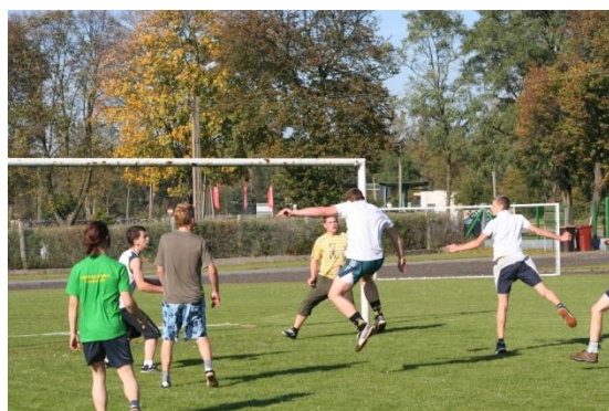
Mecz z kl. I ZSZ