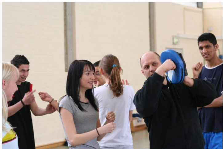
Dobrzy bokserzy zawsze się dogadają!