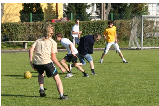
Euro 2012 tuż, tuż...