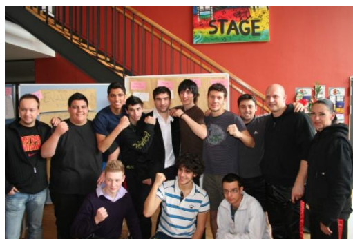
Ekipa z Włoch