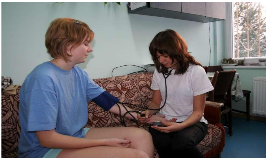
„doktor” Monika i ... i „pacjent” Monika

Podczas lekcji wychowania fizycznego wszyscy uczniowie klasy I i II technikum zostali poddani pomiarom ciśnienia tętniczego krwi.