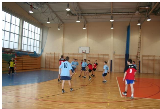
Mecz z II LO Starogard Gdański