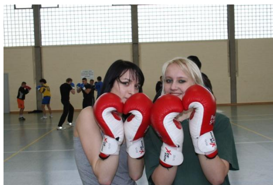
Boks może być piękny