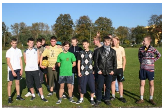
Gdzie jest Franciszek Smuda?