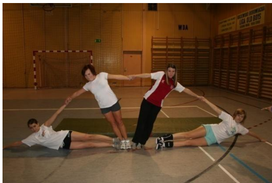
Wachlarz możliwości (nieograniczonych)