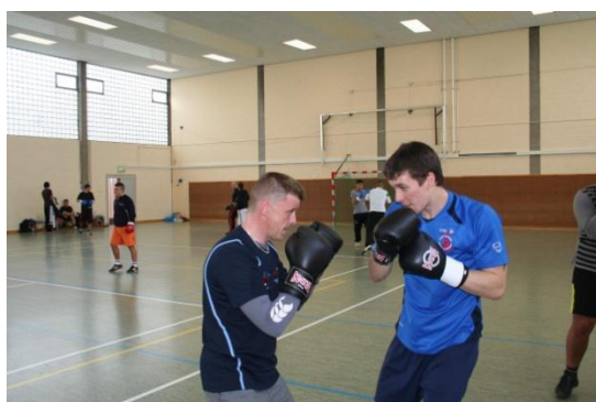
Nasi przyjaciele z Walii