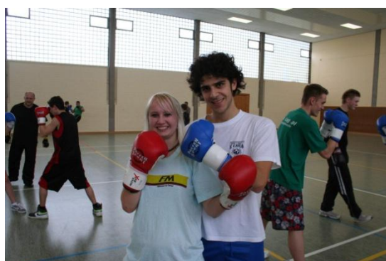
Koło Arlety zawsze kręcili się Włosi...