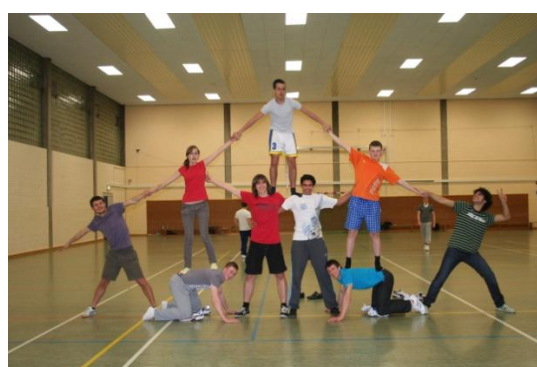
Międzynarodowa piramida bokserska