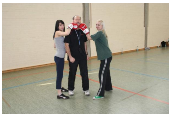
„Napad na nauczyciela”