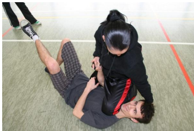
Trzy!!! i po rozmowie