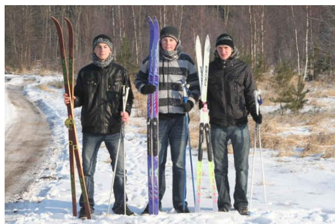
Następcy Justyny Kowalczyk