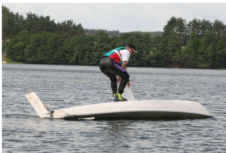
... raz na wozie (inaczej)