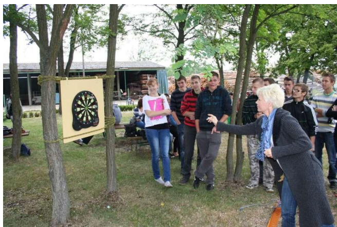
Najlepiej trafić w to czarne, okrągłe