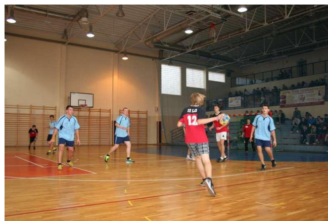
Obrona naszej bramki