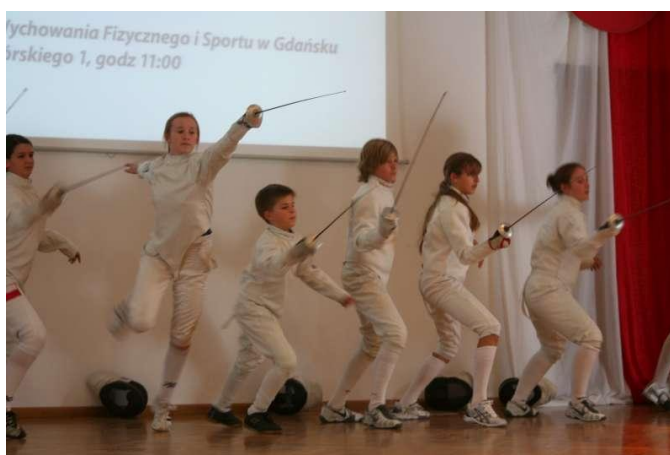
Trening pokazowy grupy najmłodszych szermierzy i ... szermierek