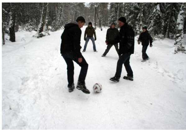
Coś biała ta trawa