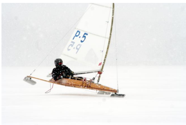
... można i tak...