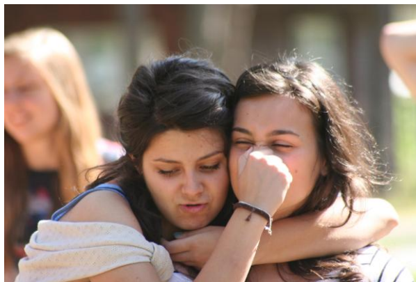
Katar to „niewygodna” choroba