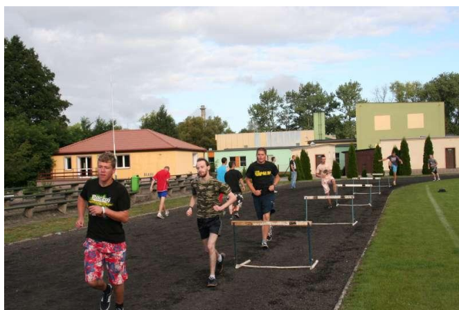
Faktycznie, bieg obok płotków jest łatwiejszy!