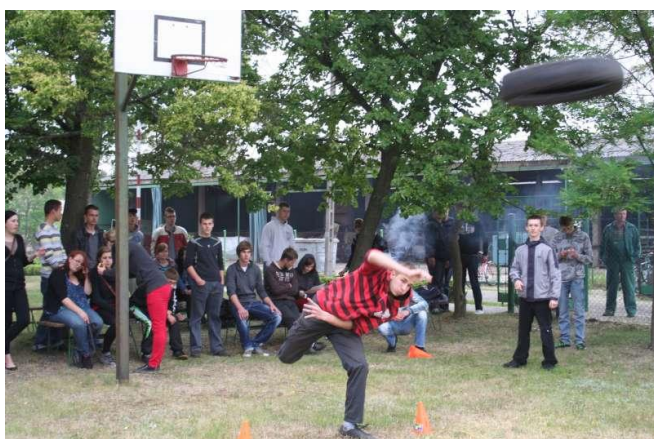
Rzut oponą... leć opono... leć