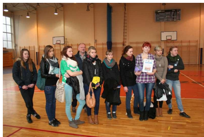
Pan dyrektor z naszą drużyną