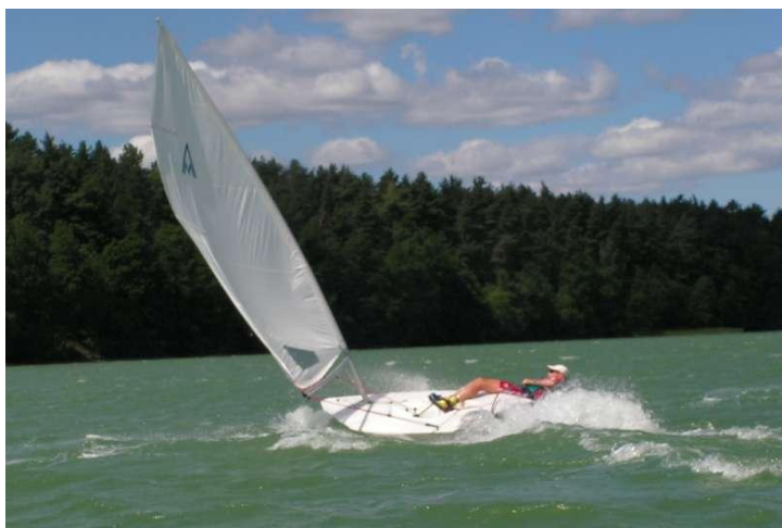
... raz na wozie