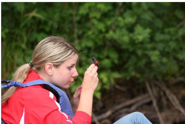
Lusterko- najważniejsza rzecz na spływie!