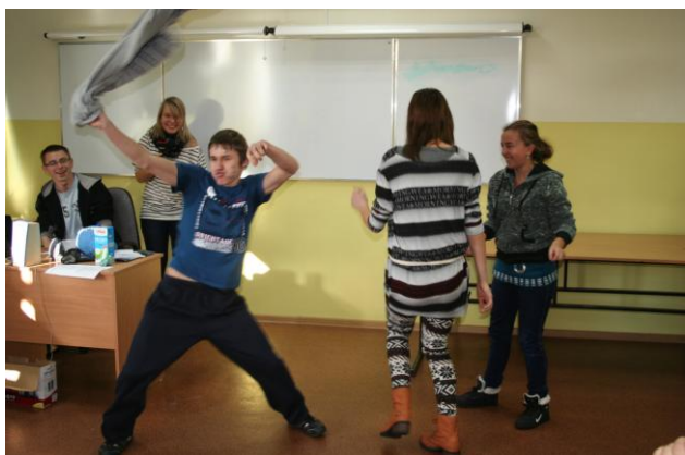
Kto mi podskoczy?