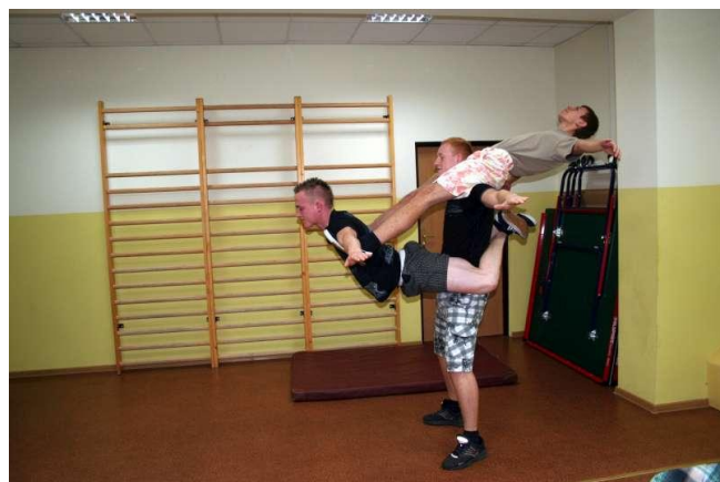
A Kamil sobie tylko stoi! Ten ma dobrze!