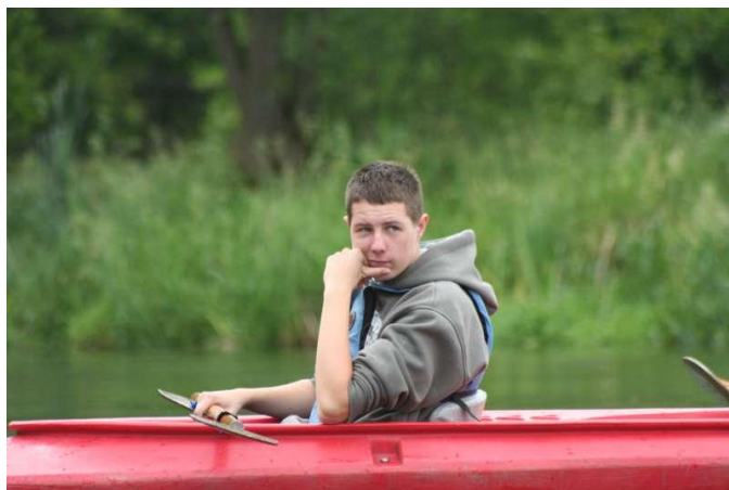
Czasami tylko płynę, a czasami płynę i myślę...