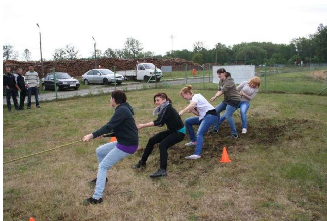
Ambitna kl. II ZSZ