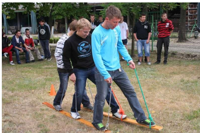
Kto to wymyślił?!!