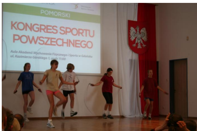
Rozgrzewka przed zajęciami szermierzy