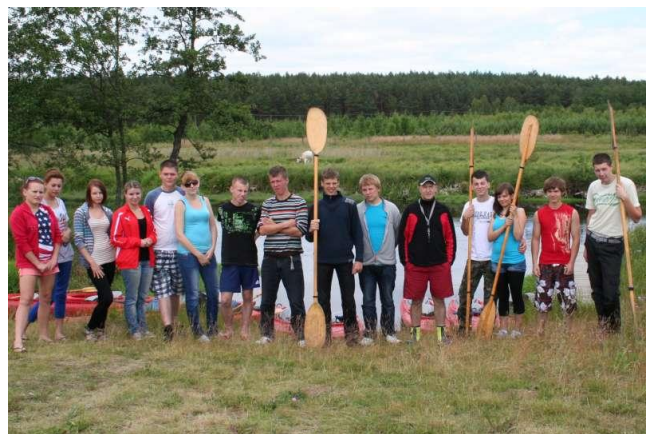
Spływ- przerwa na posiłek