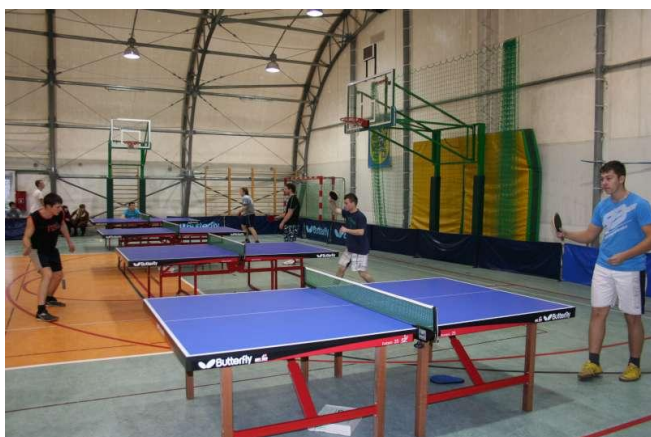
Kajetan i Radek w czasie turnieju