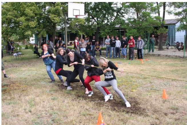
Wojowniczeki z IV T