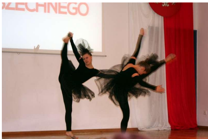
Występ grupy taneczno- gimnastycznej