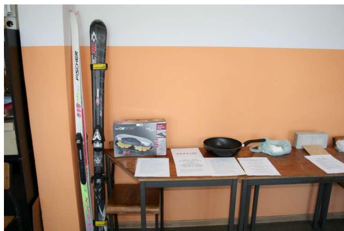
Teflon- zastosowanie w kuchni i w sporcie