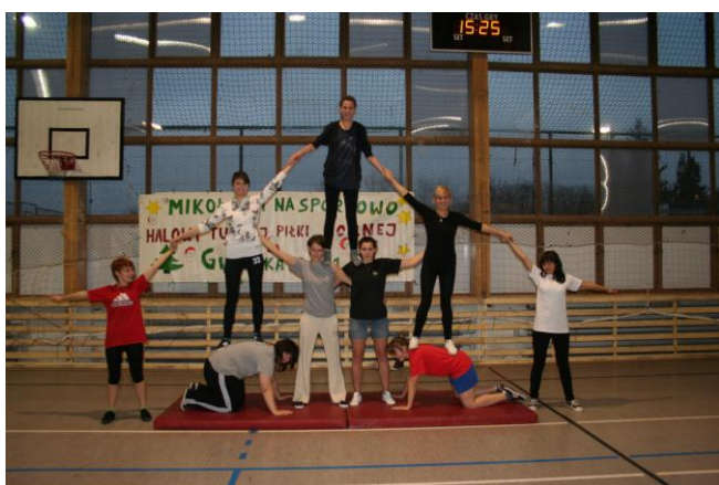
Te to potrafią każdemu wejść na głowę!