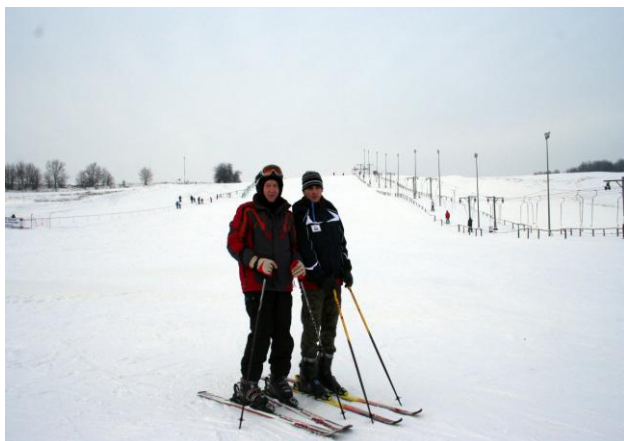
Mistrz ( ten z lewej) i ... przyszły mistrz!