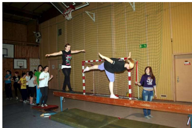
Równoważnia do łatwych nie należy