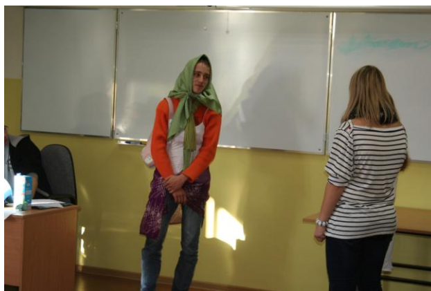
Otrzęsiny klas I