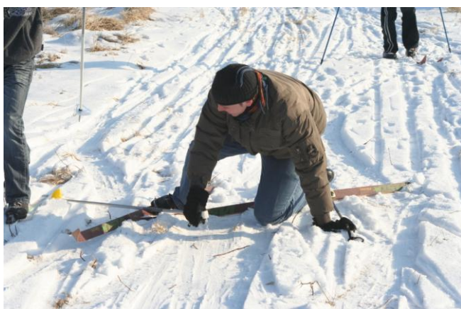
... a mówili, że lekko nie będzie