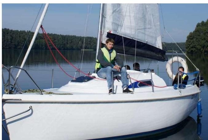
Trochę tu twardo, ale poza tym jest ok.!