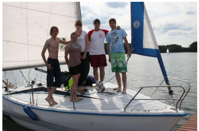
„Rodzinne” zdjęcie szkolnych żeglarzy