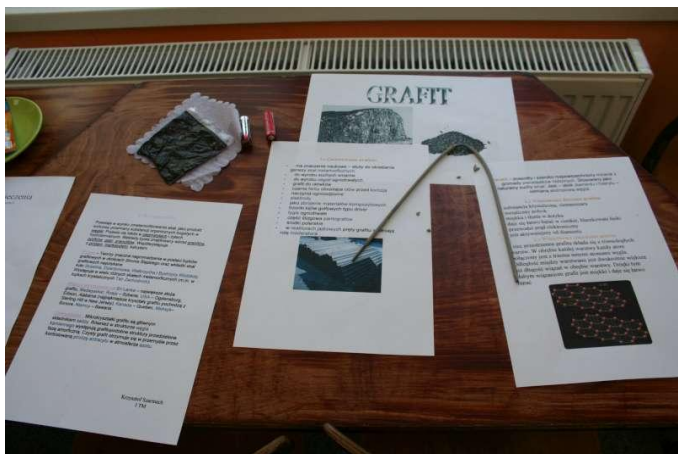
Grafit i jego zastosowanie