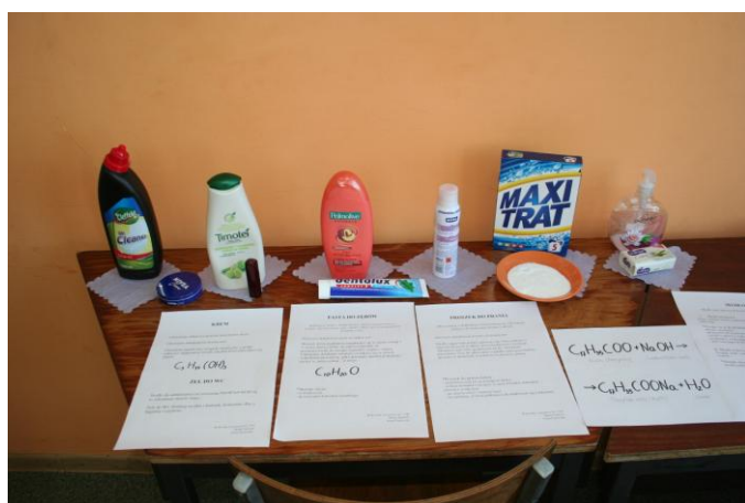
Chemia w kuchni