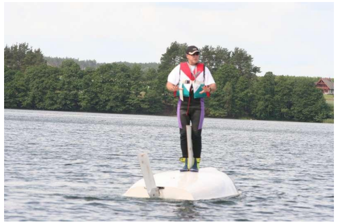
Czy ten jacht nie powinien leżeć odwrotnie?