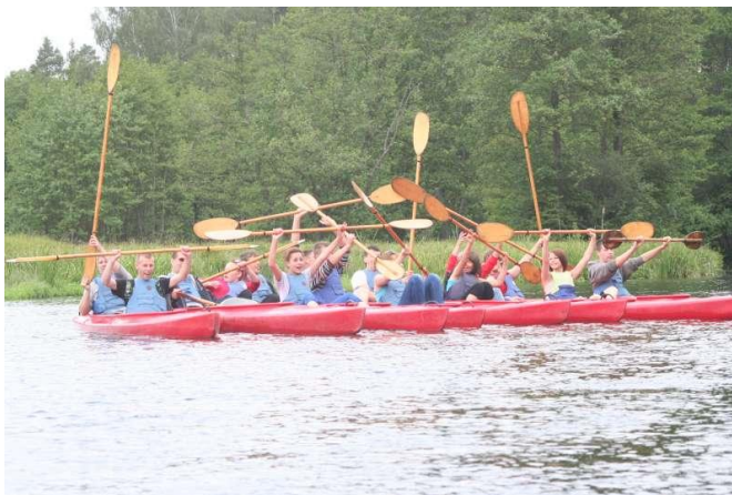
Spływ kajakowy kl. III T