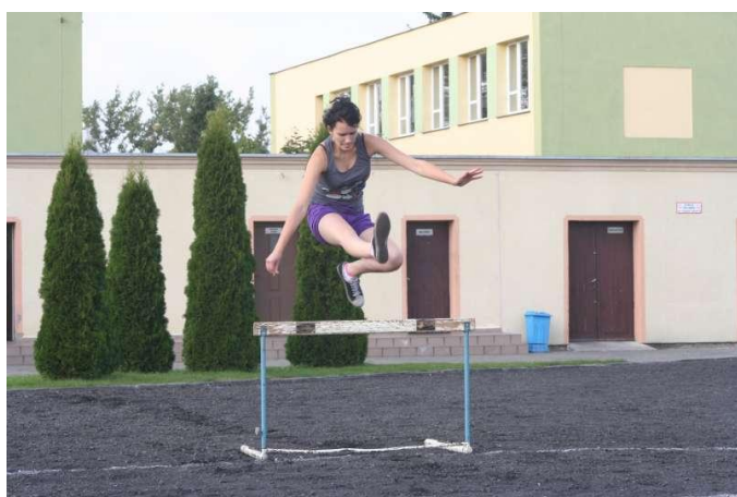
Bieg przez płotki... czy skok wzwyż?