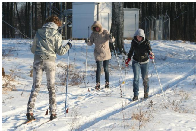
W telewizji zawsze biegają w jednym kierunku?!