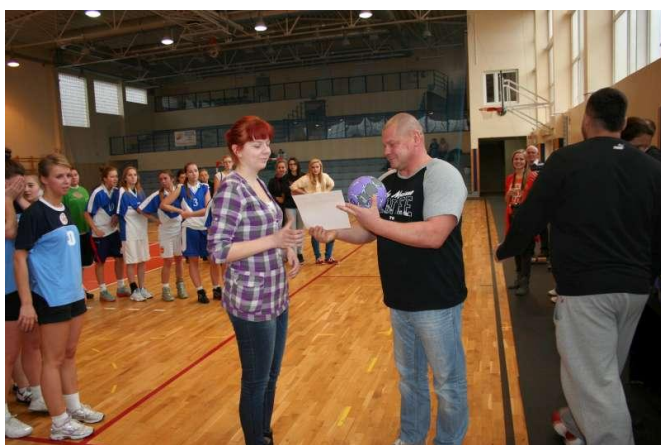
Kapitan drużyny odbiera dyplom