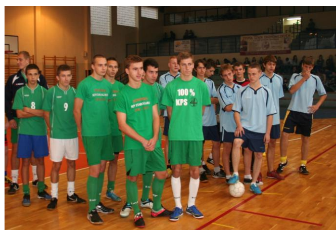
Nasi piłkarze przed turniejem