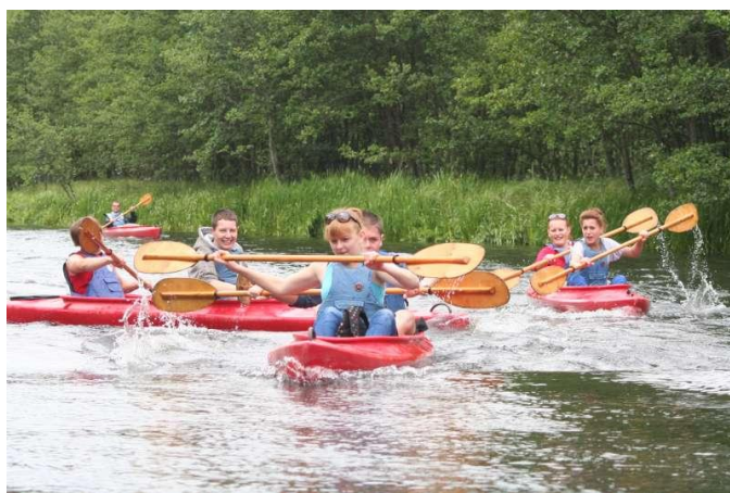
Wyścig kajakowy podczas spływu