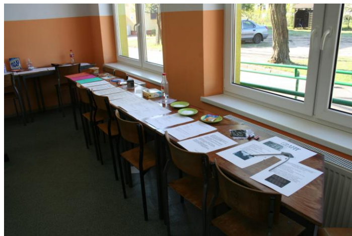
Chemia w żywności