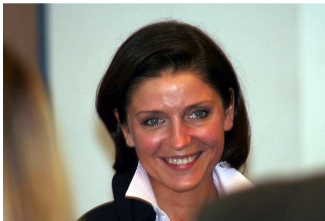
Mina pani minister po tym jak ujrzała na sali p. dyrektora oraz autora tego artykułu