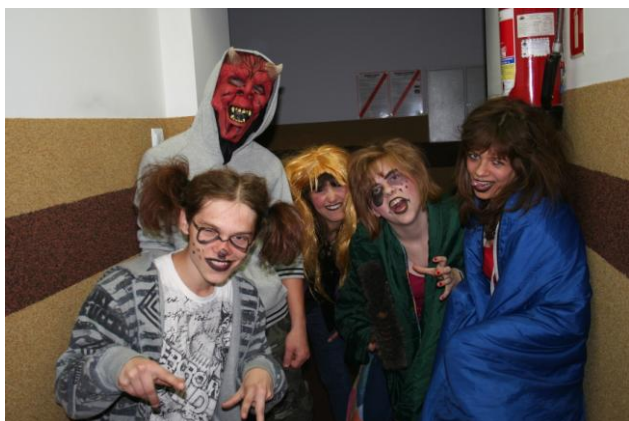
... miluszki z kl. III (wychowawcy współczujemy)