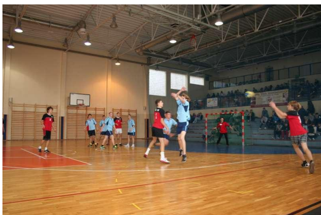
Mecz z II LO- obrona naszej bramki